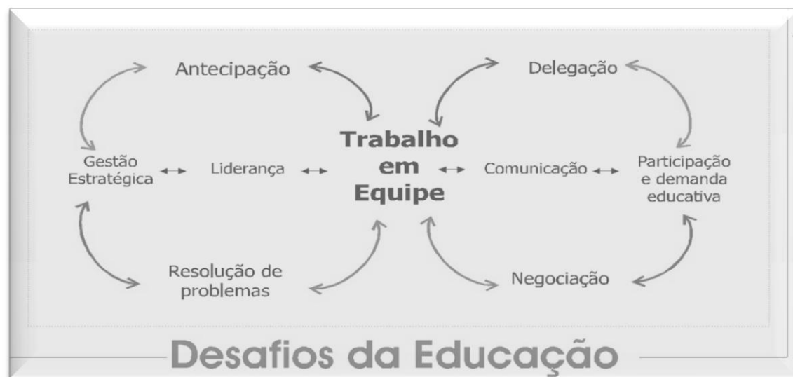
Figura 1 - Instituto Internacional de Planeamento da Educação (2000)

Reconhecemos a dificuldade em conciliar o sonho, a vontade, o empenho, o desejo e as perceções da realidade que cada um tem, com os interesses e as necessidades do grupo dentro desse todo, que é o Agrupamento. Isto exige tolerância, maturidade e capacidade de coordenação.